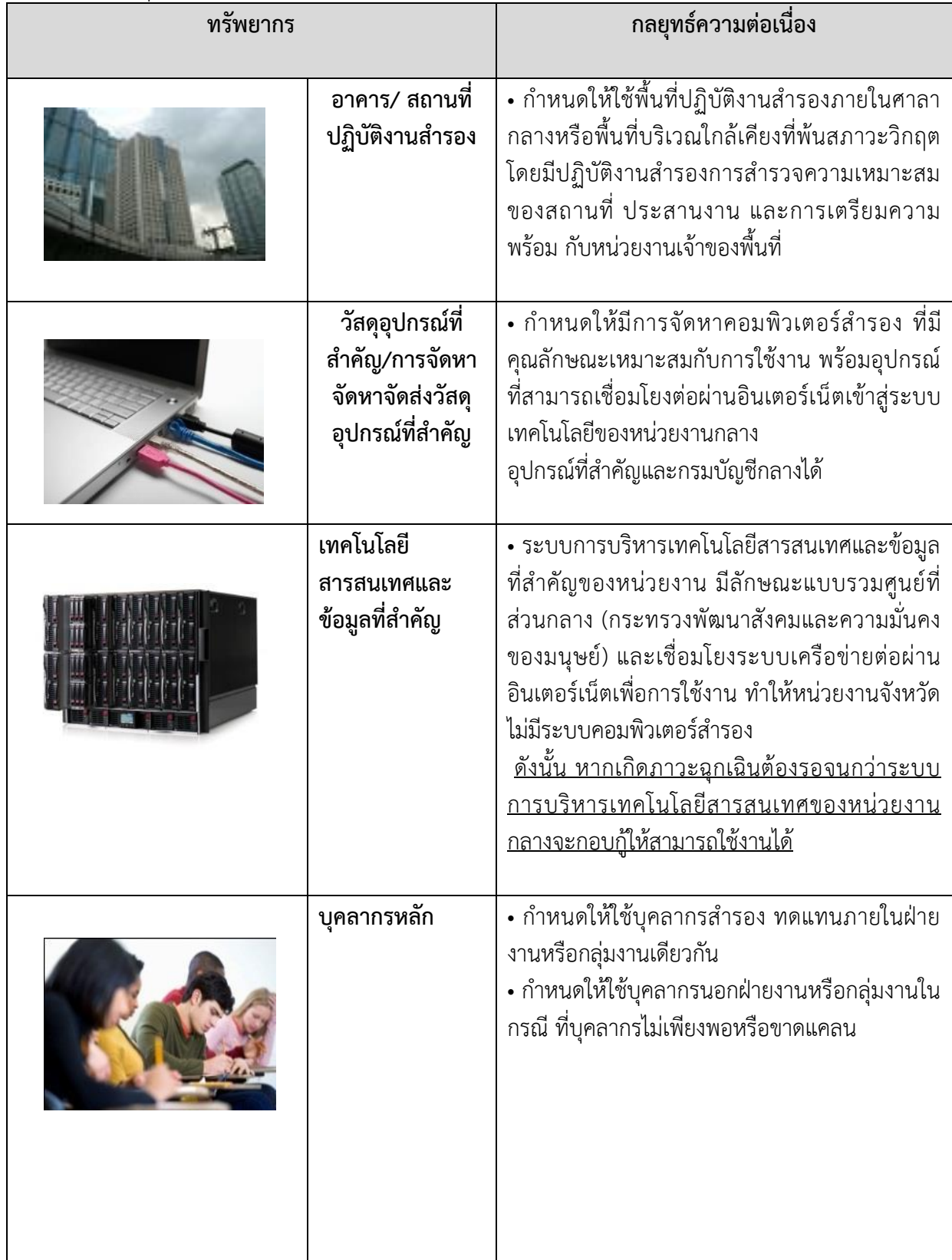
ตารางที่ ๒ กลยุทธ์ความต่อเนื่อง (Business Continuity Strategy)

กลยุทธ์ความต่อเนื่อง เป็นแนวทางในการจัดการและบริหารจัดการทรัพยากรให้มีความพร้อมเมื่อเกิดสภาวะวิกฤต ซึ่งพิจารณาทรัพยากรใน ๕ ด้าน ดังตารางที่ ๒