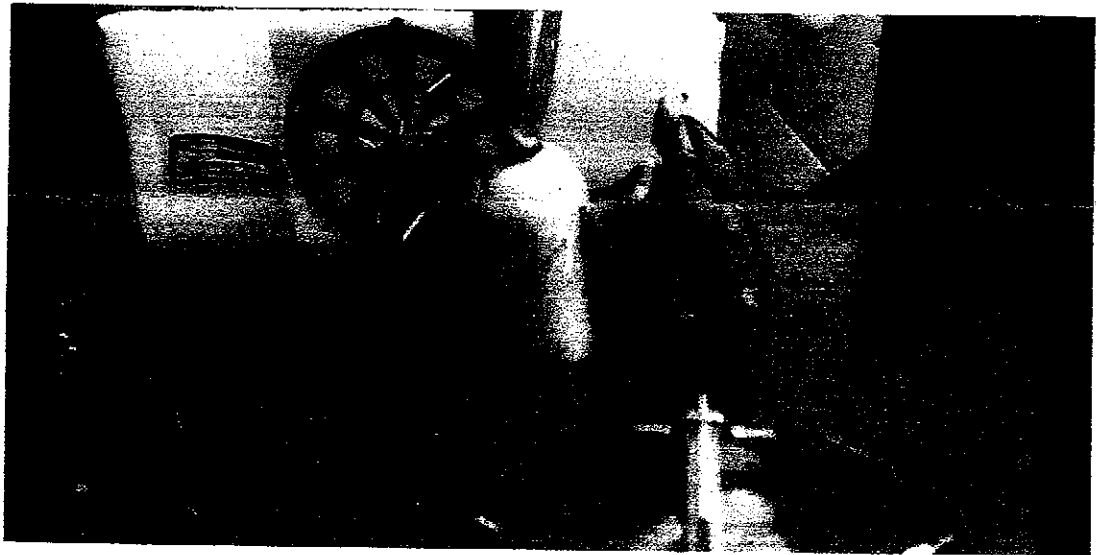
ภาพที่ ๓ ทดสอบการยิงหน้าไม้จิวด้วยไม้จิ้มฟัน ไปยังผัก ผลไม้ รวม ๓ ชนิด ได้แก่ แครอท หัวไชเท้า และแก้วมังกร